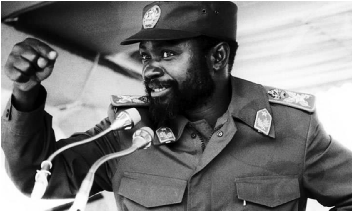
Figura Samora Machel foi Presidente de Moçambique