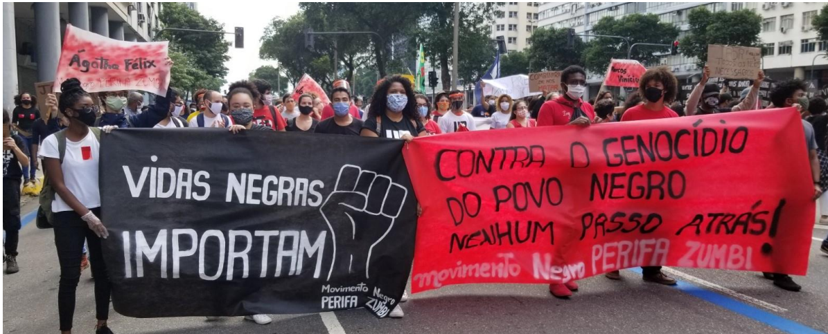
Ato contra o racismo