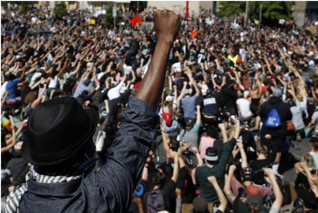
Atos no EUA contra o racismo e a morte do negro George Floyd pela polícia

os seus líderes. Fora dos padrões normativos dos valores políticos europeus, civilizados e "normais", não existiam movimentos que pudessem ser enquadrados como aceitos pelas nações dominadoras, como continuadores do "sentido" da civilização. As próprias lutas de libertação nacional eram (como acontece até hoje) consideradas revoltas intertribais, movimentos atípicos e perturbadores do processo civilizatório. Não tínhamos acesso à história, à civilização e à igualdade de direitos. A nossa inferioridade congênita e inapelável — biológica e psicológica — nos reduzia a satélites do processo civilizatório.