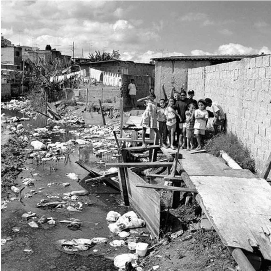
Foto de Mariana Fix para o seu livro São Paulo cidade global: fundamentos financeiros de uma miragem (São Paulo, Boitempo, 2007).

Este livro foi publicado em abril de 2015, vinte anos após ter início a remoção da favela Jardim Edite, em São Paulo, cujos moradores foram expulsos pelo poder do capital e da especulação imobiliária.